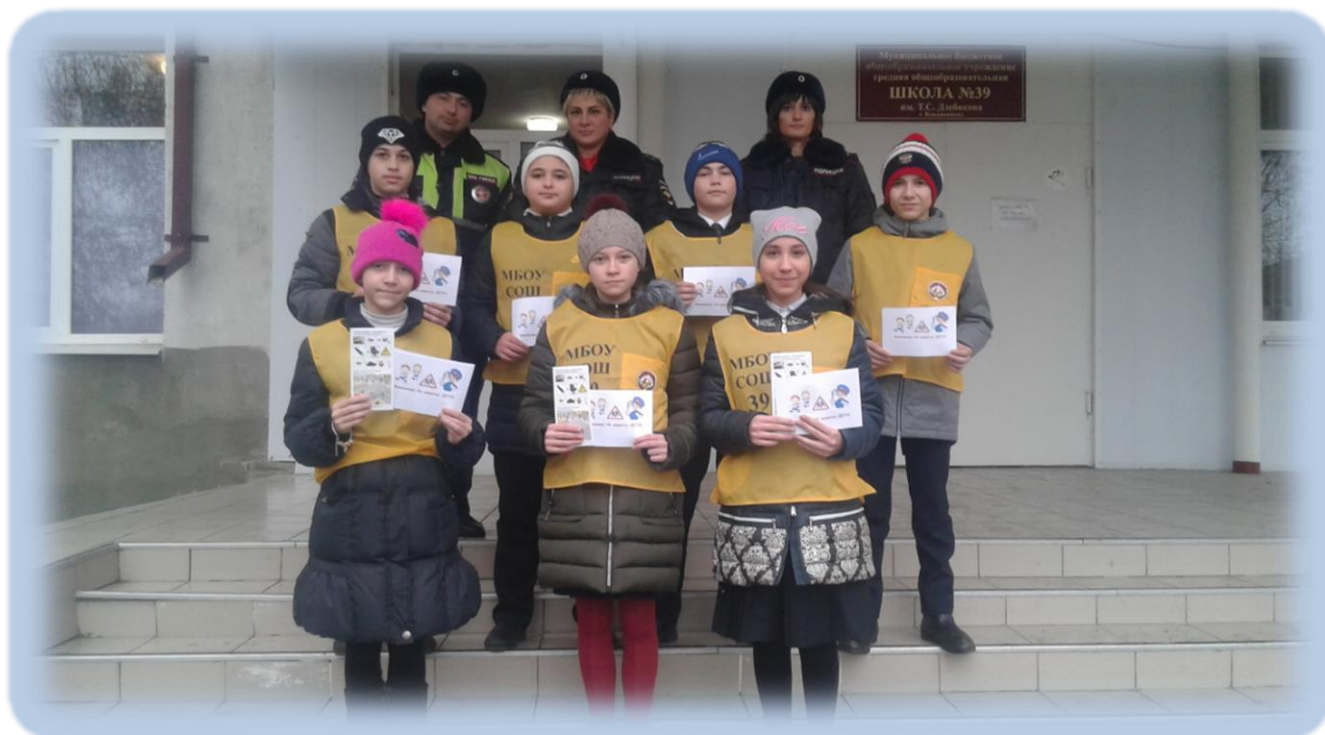
В канун празднования Дня матери с 24 по 28 ноября 2019 г. классными руководителями были проведены классные часы, конкурс детских рисунков «Мама –