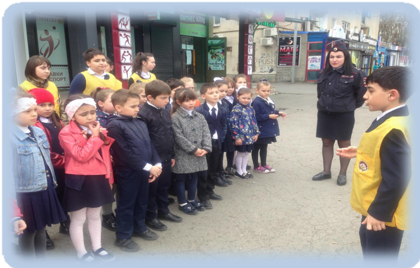
26 декабря 2019 года отряд ЮИД провёл акцию «Письмо водителю» совместно с сотрудниками ОГИБДД УМВД России по г.Владикавказ.